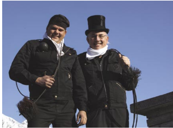
Schornsteinfeger bündeln Know-how und Erfahrung

Schaltstelle für alle Fragen rund um Energieeffizienz, Sicherheit und Umweltschutz im Haus. Fundierte Ausbildung und die regelmäßige Überprüfung durch unabhängige Kontrollinstanzen garantieren höchste Beratungskompetenz. Mit geschultem Auge erkennt er die Mängel des Gebäudes