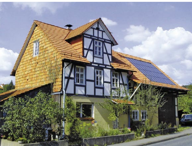
Der Energiebedarf von Alt- und Neubauten muss sinken

Das Förderprogramm wurde im Vergleich zum Vorjahr ausgeweitet. So werden im Rahmen der Öko-Plus-Variante des Programms „Wohnraum Modernisieren“ nun auch Einzelmaßnahmen wie die Erneuerung der Fenster aus Haushaltsmitteln des Bundes gefördert. Bisher war die Finanzierung nur für festgelegte Kombinationen möglich. Darüber hinaus können Eigentümer von Ein- und Zweifamilienhäusern und Eigentümergesellschaften zusätzlich zur bestehenden Förderung für Einzelmaßnahmen einen Zuschuss erhalten. „Auf diese Weise amortisieren sich die Investitionen meist innerhalb von wenigen Jahren“, so der BHW-Experte Neuborn.