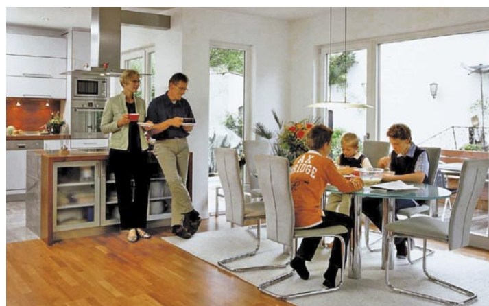
5523 BHW Bausparkasse/Platz Haus

Laut Statistik planen die Menschen in Deutschland den Erwerb eines Eigenheims meist im Alter zwischen 30 und 40 Jahren. Dann hat sich das Leben zwischen Job und Familie eingependelt und „Sesshaftigkeit“ ist gefragt. Doch in Zeiten wachsender beruflicher Mobilität und später Familiengründung hat das Konzept einer Immobilie für das ganze Leben zunehmend ausgedient. Laut einer aktuellen Umfrage der BHW Bauspar-