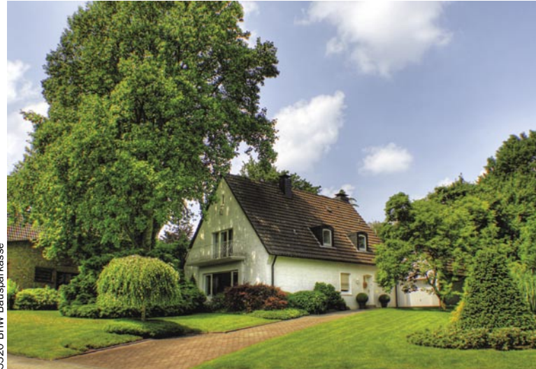
5520 BHW Bausparkasse

Bausparkasse: „Besonders, wenn die Finanzierung sehr knapp ist, spricht auch ein geringer finanzieller Minderbetrag für ein Erbpachtgrundstück.“ Auf jeden Fall soll-