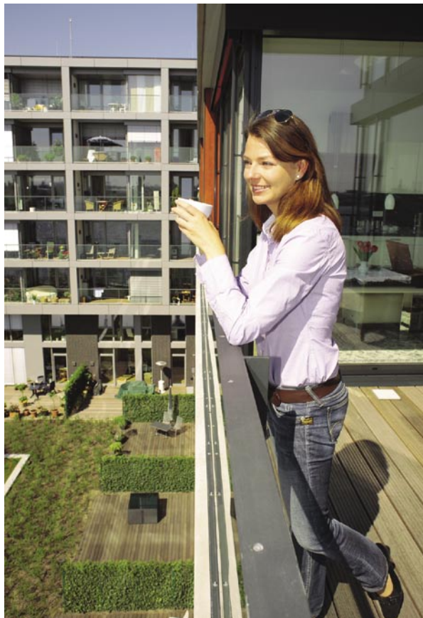
5522 BHW Bausparkasse

Knapp die Hälfte aller „Alleinlebender“ sind Überzeugungstäter! Und sie möchten ihren Lebensstil auch beibehalten: Laut einer aktuellen Umfrage der BHW Bausparkasse wollen 47 Prozent der Befragten, die heute alleine leben, auch in zehn Jahren noch in einem Single-Haushalt wohnen. Rund 21 Prozent planen in zehn Jahren zusammen mit einem Partner zu leben, lediglich zwölf Prozent wollen eine Familie gründen. Single-Wohnen entwickelt sich somit zunehmend von einer Übergangsphase in jungen Jahren zu einer