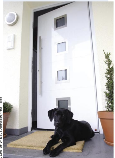
5198 BHW Bausparkasse/Hörmann

Eingangstüren aus Aluminium finden immer mehr Liebhaber. Und das hat mehrere Gründe: Das Metall lässt sich vielseitig bearbeiten und ermöglicht vielfältige Optiken: von Metallic- und Eisenglimmer-Beschichtungen bis zu Glas- oder Holzeinsätzen. Hier sind der Fantasie keine Grenzen gesetzt, viele Her-