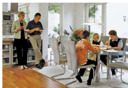
Eine Immobilie für jede Lebenslage (S. 8)