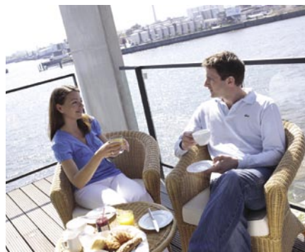
Im Trend: nah am Wasser bauen (S. 4)