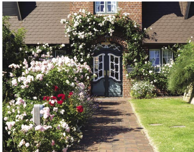
Immobilien aus zweiter Hand: Drum prüfe, wer sich bindet ...

Zu den Problemfeldern zählen unter anderem: Feuchtigkeit, die in die Wand eindringt, asbesthaltige Heizkörperdämmung, Wasserrohre aus bleihaltigem Material, elektrische