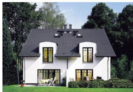
Doppeltes Wohnglück (S. 5)