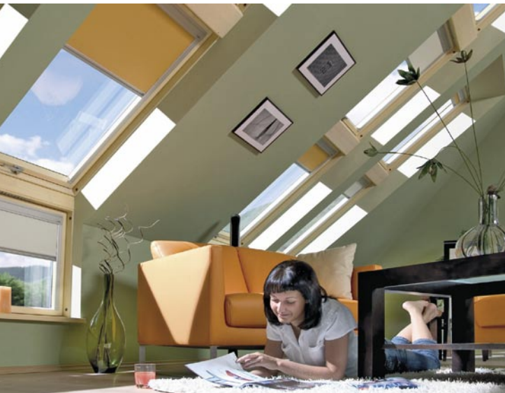
5512 BHW Bausparkasse/Fakro

Energie eingespart werden. „Die intelligenten Programme regulieren aber nicht nur die Sonneneinstrahlung“, weiß Rüdiger Grimmert von der BHW Bausparkasse. „Sie schaffen auch Sicherheit. Durch das Einrichten von Zufallszeiten während eines Urlaubs simulieren sie Anwesenheit und schrecken Einbrecher ab.“ Ein Steuerungsgerät mit Basisfunktionen kostet ohne den Einbau circa 80 Euro und kann in alle handelsüblichen Rollladen-Systeme integriert werden.