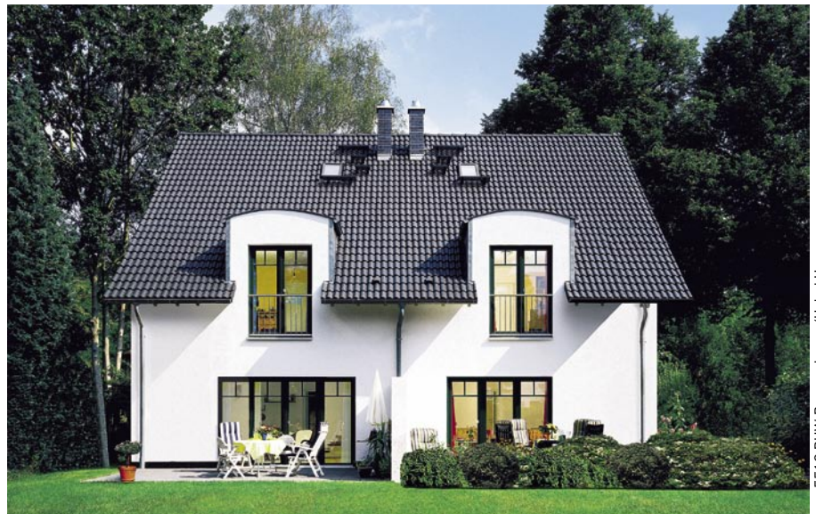
5516 BHW Bausparkasse/Hebel Haus

Nach dem Einzug sind Doppelhäuser wahre Sparmeister bei den Heizkosten. Denn auch hier macht sich das Fehlen einer kompletten Außenwand bemerkbar. Die Nachbarn schützen sich gegenseitig gegen Wärmeverluste. Dennoch braucht sich keiner vor zu enger Berührung fürchten, wie Rüdiger