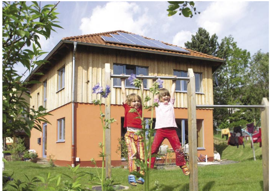
Wertbeständig und krisensicher: mit Bausparen zur Traumimmobilie (S. 2)