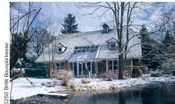
5250 BHW Bausparkasse

Für Bausparen ist es nie zu spät! Wer es tut, den fördert der Staat mit attraktiven Prämien. Klassische Fördermittel sind Arbeitnehmersparzulage, Wohnungsbauprämie und Wohn-Riester. Diese Prämien erhalten Sparer in voller Höhe, wenn sie bis Ende des Jahres einen Bausparvertrag abschließen, die erforderlichen Beträge entrichten und dabei bestimmte Einkommensgrenzen nicht überschreiten. Die Arbeitnehmersparzulage wird allen Bausparern gewährt, die ihren Anspruch auf vermögenswirksame Leistungen (VL) geltend machen. Je nach Branche schießt der Arbeitgeber zwischen sechs und 40 Euro monatlich dazu, das sind bis zu 470 Euro jährlich. Werden die VL in einem Bausparvertrag an-