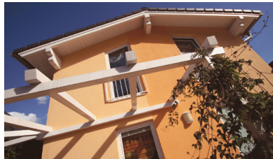
Ein neuer Look für die Fassade

Da haben Schmutzpartikel, Algen oder Pilzsporen keine Chance – Silikonharzfarben haben den „Lotuseffekt“ und sind so stark wasserabweisend, dass unerwünschte Beläge vom nächsten Regen fortgespült werden. „Fotokatalytische Anstriche“ setzen auf ein chemisches Prinzip und reinigen sich ganz von selbst. Die Farbe ist mit Titanoxid angereichert, das Staub und Ruß zersetzt und abbaut. Qualität hat ihren