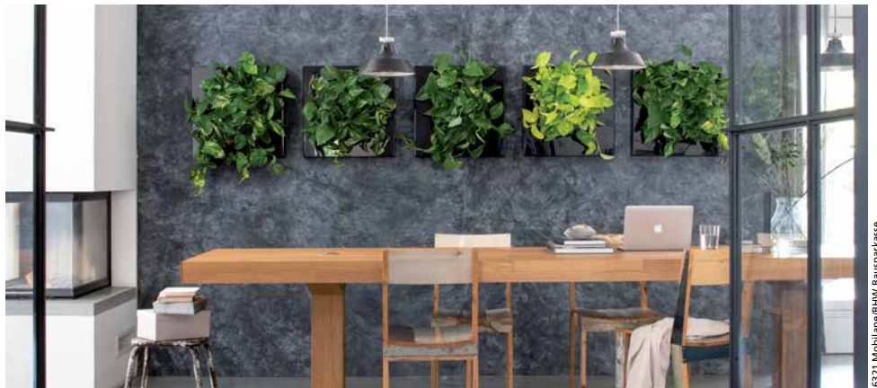
Pflanzenbilder: Im Bilderrahmen versteckt sich ein Wasserspeicher

Mehr Grün für ein besseres Klima, dieser Wunsch macht auch vor Innenräumen nicht halt. In Wohnzimmern sorgen immer häufiger dekorative Pflanzenwände für eine wohltuende Raumluft.