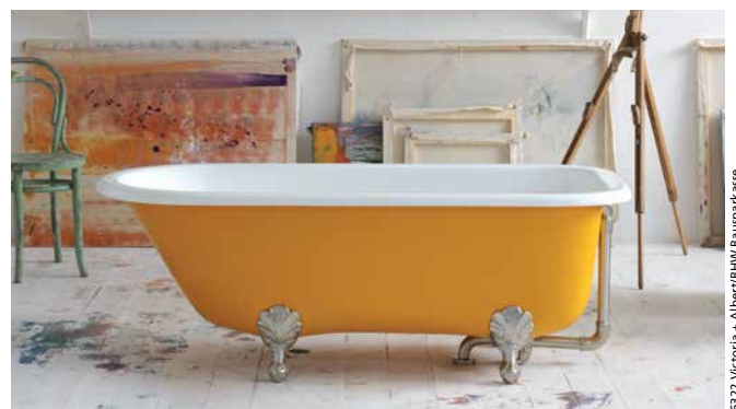
Da geht die Sonne auf: Badewanne in Gelb

Badewannen in Narzissengelb, Moosgrün, Blau oder Purpurviolett – das ist neu. Auch wenn sie auf der Innenseite in der Regel weiß gehalten sind, bunte Badewannen geben in der Wellnesszone immer häufiger den Ton an. Nicht nur bei der Farbe, sondern auch bei der Form der Wanne haben Badmodernisierer die Qual der Wahl: rund, oval oder kantig, modern oder anheimelnd wie alte Waschzuber. Die Auswahl ist schier unbegrenzt und macht auch nicht vor den Materialien halt. Je nach Hersteller werden die Wannen aus Acryl, Keramik, Naturstein oder sogar Holz gefertigt. Die Preise variieren dabei stark. Es