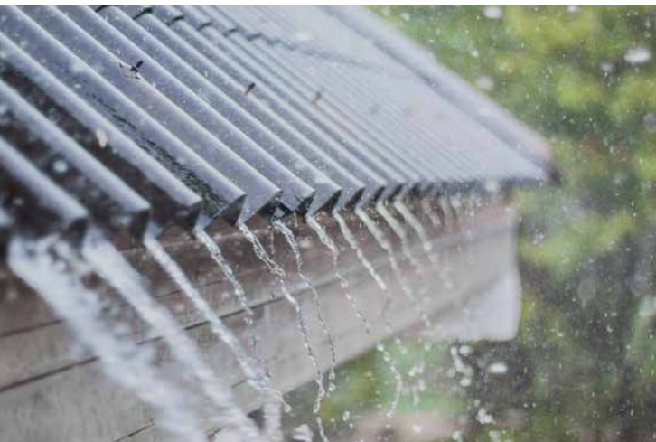
Regen kann im Haushalt jährlich 60 Kubikmeter Trinkwasser ersetzen

Bei einer Spülung rauschen im Schnitt zehn Liter Trinkwasser durch die Toilette. Dafür könnte man auch Regenwasser nutzen! Genau wie für die Waschmaschine und natürlich den Garten. Doch wie sieht es mit der Machbarkeit aus?