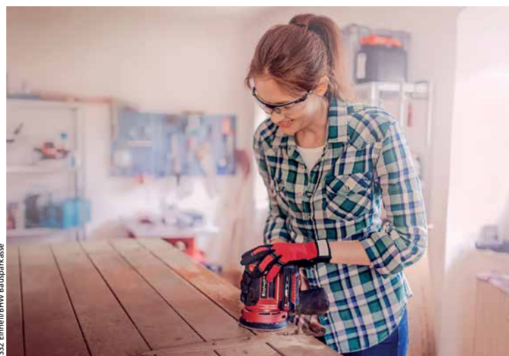
Handwerklich Begabte können viel Geld sparen, indem sie mitrenovieren

Damit sich die Arbeiten nicht in die Länge ziehen und Mehrkosten entstehen, suchen Sie Handwerker, die mit anderen Gewerken vernetzt sind. So läuft es meist reibungsloser.