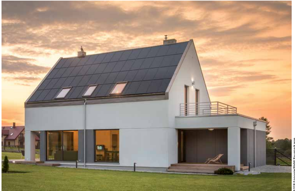
Abendstimmung für die Einspeisevergütung? Wer sich den Zuschuss sichern will, muss jetzt handeln

muss heute nicht einmal mehr physisch auf dem eigenen Grundstück installiert werden, weil immer mehr Stromanbieter Cloud-Lösungen anbieten. Private Betreiber können den zu viel produzierten Strom ins Netz einspeisen, Guthaben sammeln und später selbst verbrauchen. Verwalten können sie das ganze mit einer App. Bei der Cloud-Lösung gilt es jedoch zu beachten, dass man sich von einem Stromanbieter abhängig macht.