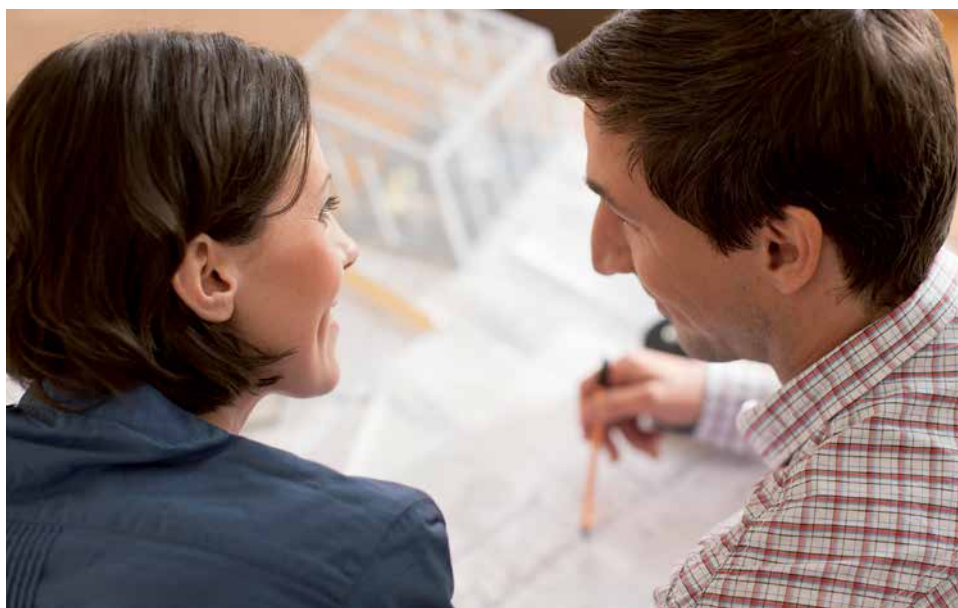
Je energieeffizienter das Haus werden soll, umso mehr Förderung gibt es für die Sanierung

Alte Haustüren entsprechen zwar häufig nicht dem heutigen Standard, weil sie weder gedämmt noch einbruchssicher sind. „Stillecht sind sie aber allemal“, sagt die BHW Expertin, „und das Reparieren kommt immer stärker in Mode.“ Bevor man zwei bis viertausend Euro für eine neue Holztür ausgibt, kann man besser einen Tischler fragen, ob er das gute Stück nachrüsten kann. Auch abgenutzte Treppen müssen nicht gleich ersetzt werden: Solange die Statik intakt ist, können sogenannte Renovierungsstufen aufgesetzt werden.