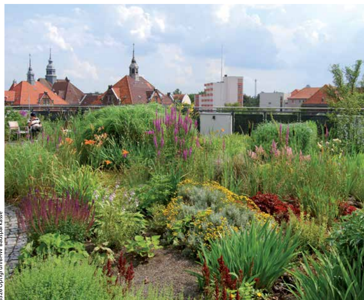
Gründächer wirken als natürliche Wärmedämmung und sparen Heizkosten

Die Begrünung von Dächern wird heute bereits von vielen Kommunen gefördert. Weit mehr als ein ökologisches Deckmäntelchen, helfen sie, die Luft zu reinigen, Regenwasser zu speichern und die Kanalisation zu entlasten. Wer sein Dach begrünt, profitiert gleich mehrfach.