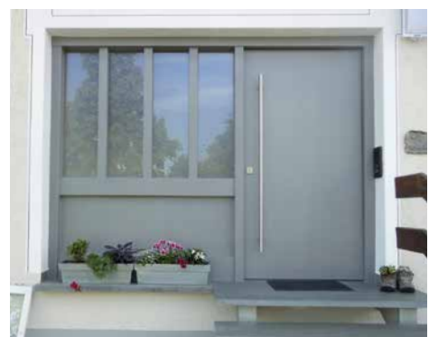
Grau und Edelstahl peppen diese Tür auf

Baumaterial kann man auch gebraucht kaufen, etwa online über das Bauteilnetz Deutschland. Das ist nicht nur günstiger, sondern auch umweltschonend. Wer stilgerechtes Baumaterial sucht, um damit zum Beispiel fehlende oder beschädigte Dachpfannen zu ersetzen, kann unter historische-baustoffe.de fündig werden. Und: Es muss nicht immer gleich das komplette Dach neu gedeckt werden. Doch Vorsicht, die Materialwahl sollte man vor der Bestellung mit den Handwerkern abstimmen. Viele Betriebe übernehmen keine Garantie bei der Verarbeitung von recyceltem Material.