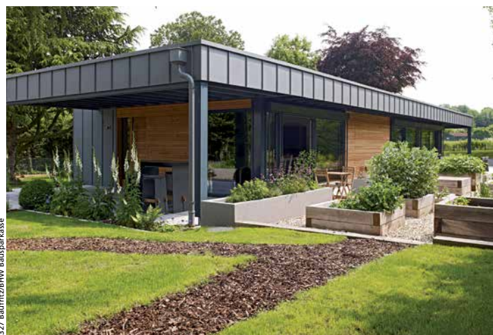
So modern kann der altbewährte Baustoff Holz wirken

Holzprodukte aus nachhaltig bewirtschafteten Wäldern weltweit werden mit diesen Siegeln kenntlich gemacht. Alle ausgezeichneten Produkte sind ökologisch und nachhaltig hergestellt, die Produktionskette ist dokumentiert.