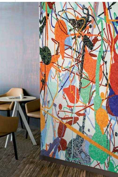
Mosaiken: Zauber aus Form und Farbe

Bereits in der Antike wurden Wände eindrucksvoll mit großformatigen Mosaiken geschmückt. Die Kunst, bunte Teilchen aus farbigem Glas, Feinsteinzeug oder Keramik zu faszinierenden Ornamenten anzuordnen, findet heute wieder viele Anhänger. Original gefertigte Künstlermosaiken können