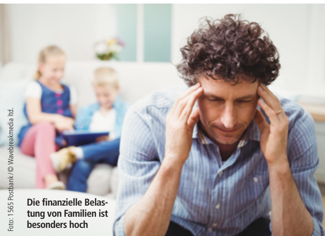
Die finanzielle Belastung von Familien ist besonders hoch

MAGAZINWERKSTATT Claudia Mögling www.magazinwerkstatt.de